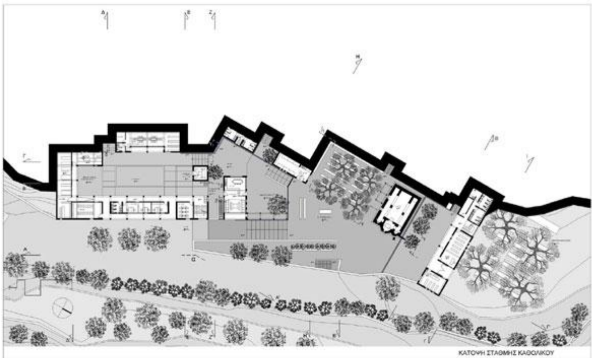
ΚΑΤΟΨΗ ΣΤΑΘΜΗΣ ΚΑΔΟΙΑΚΟΥ